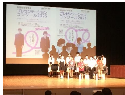
岩沼市プレゼンテーションコンクール 2023 【9.13 岩沼市市民会館にて】