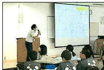
宮城県教育委員会主催「算数チャレンジ大会」【9.16 総合教育センターにて】